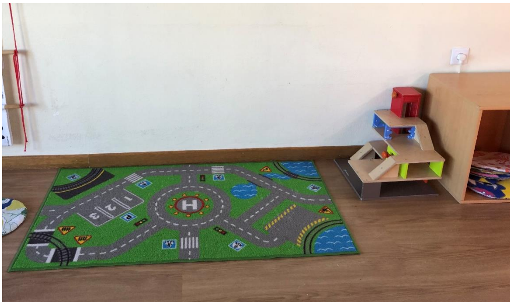
Área da Garagem