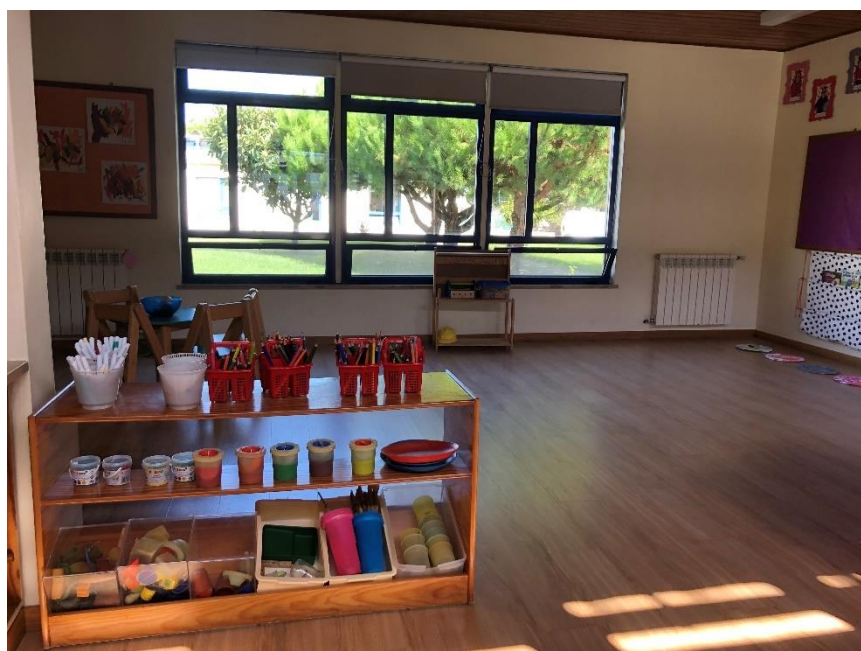
Área da Expressão Plástica