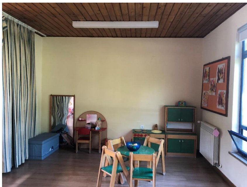
Área do “Faz de Conta” – “Casinha das Bonecas”

Está organizada por áreas pedagógicas, de acordo com os interesses e necessidades das crianças.