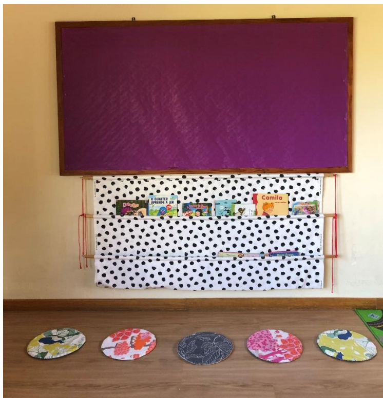
Área da Leitura