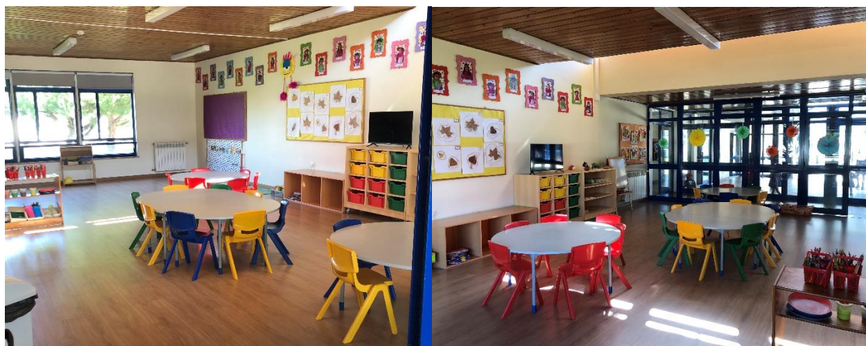
Área da Escrita e dos Jogos de Mesa